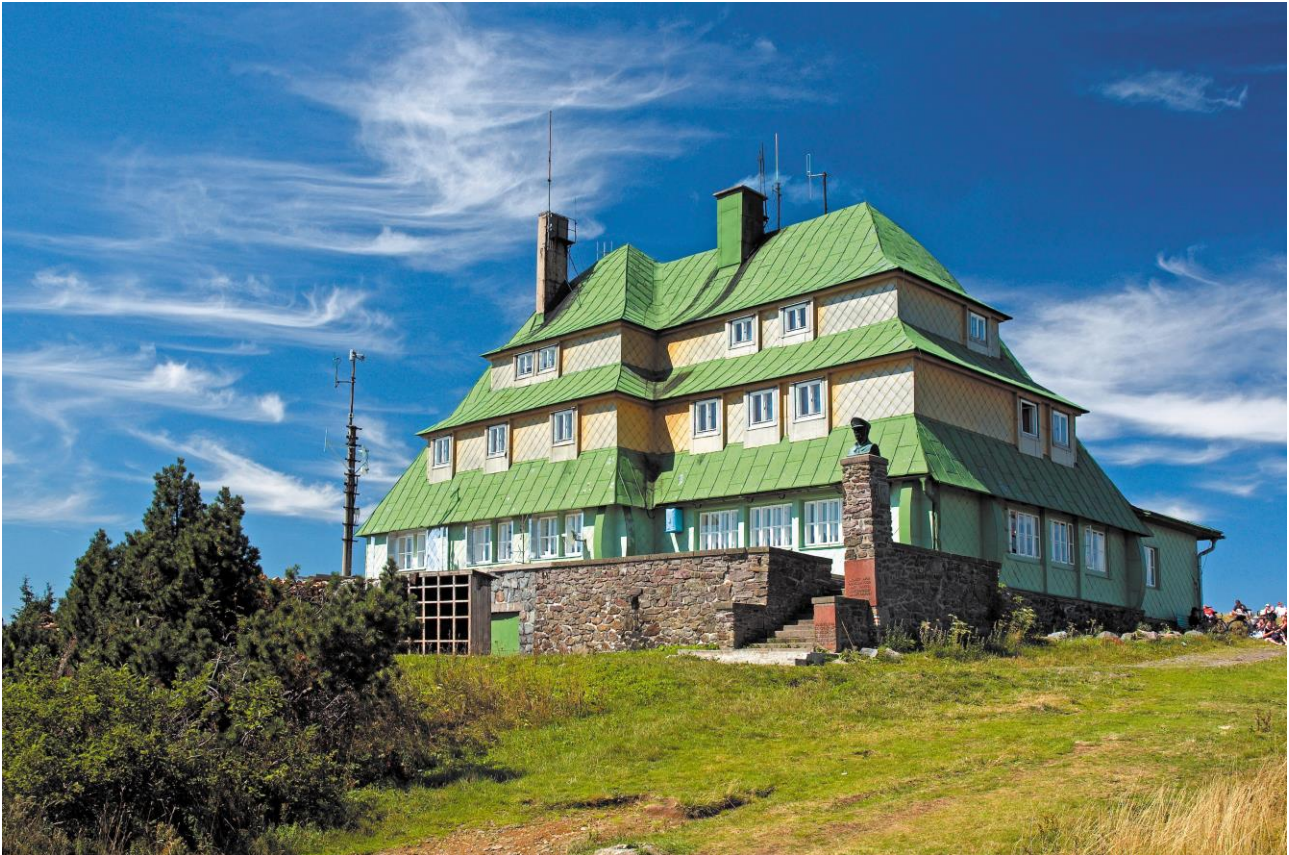
Schronisko Masarykowa Chata.